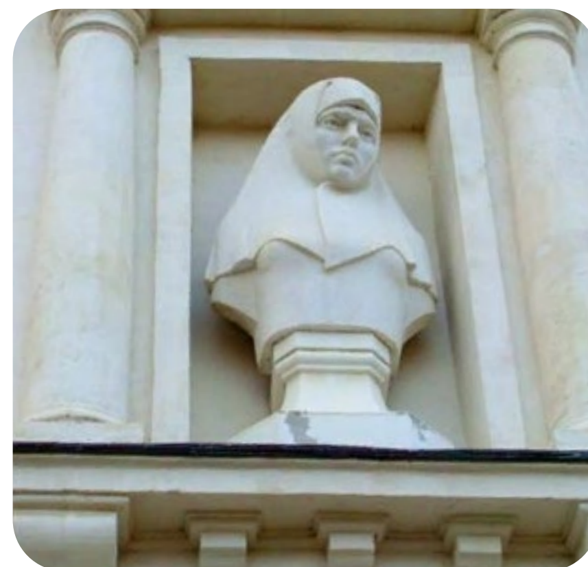
Благодарная память потомков

Не имея медицинского образования, Даша Севастопольская оказывала помощь раненым и больным защитникам Севастополя, на свои средства оборудовала первый походный перевязочный пункт.