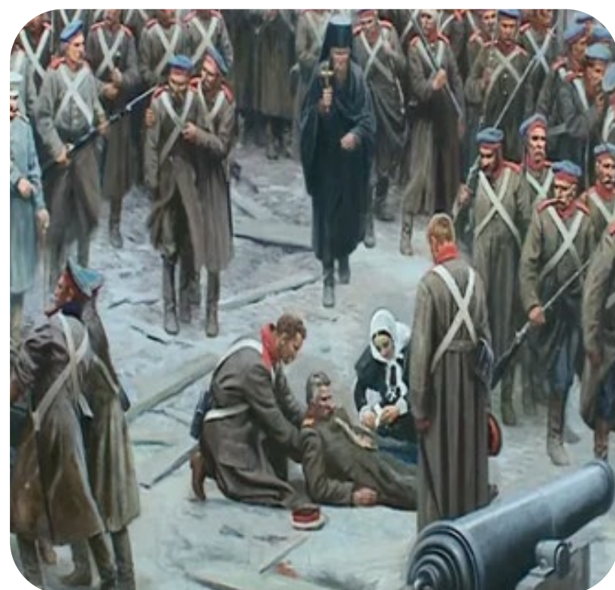
Роль в судьбе региона и страны

Одна из первых военных сестер милосердия, героиня обороны Севастополя в Крымскую войну 1853-1856 гг.